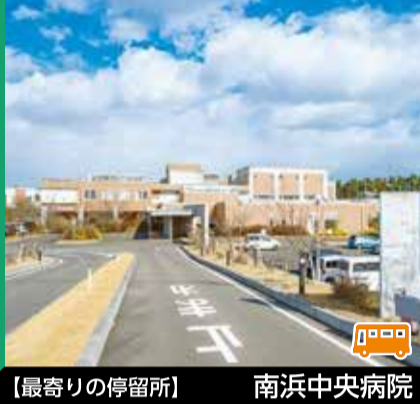
【最寄りの停留所】 南浜中央病院