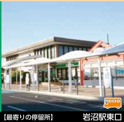
【最寄りの停留所】 岩沼駅東口